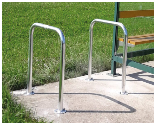
Bügellänge 650 mm, verzinkt, aufgedübelt

Zum Einbetonieren: mit verlängerten Standrohren