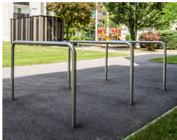
Bügellänge 1500 mm, Edelstahl, einbetoniert