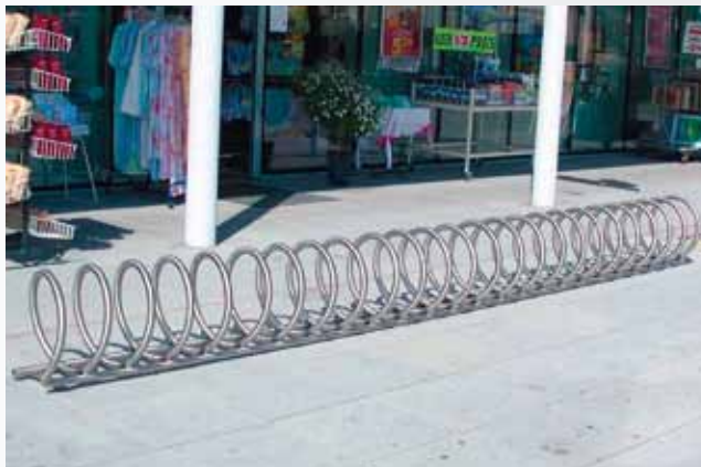
FS/ SPIRAL 415/ NI/ A + FS/ SPIRAL 410/ NI/ A

Befestigungsarten: • Zum Aufdübeln: Im Prinzip steht der Fahrradständer Spiral 400/800 für sich alleine. Er sollte jedoch gegen Vandalismus, Verschieben und Umkippen am Boden befestigt werden.