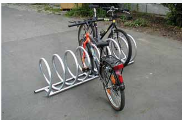
FS/ SPIRAL 409/ NI/ A