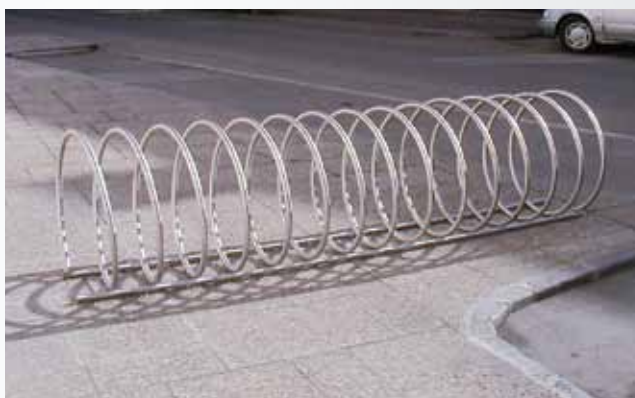
FS/ SPIRAL 815/ NI/ A