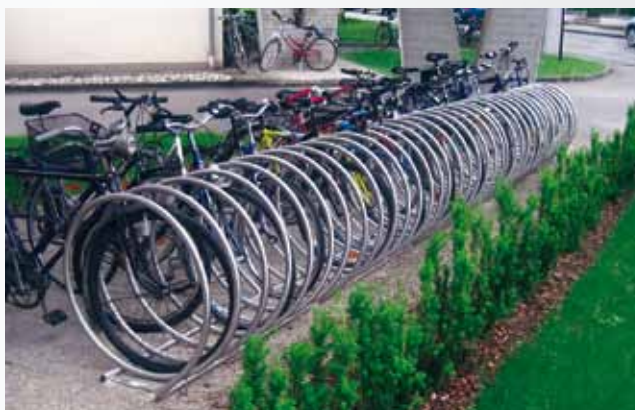
2 Stk. FS/ SPIRAL 818/ NI/ A