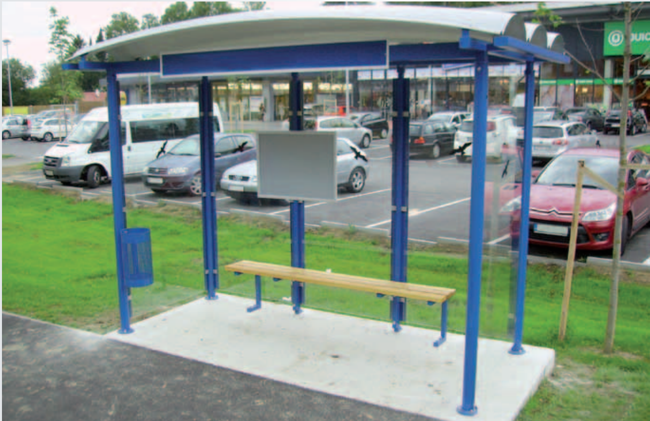
WH/ A/ 3/ 12/ PD (mit Zubehör: s. S. 31-33)

Das Wartehaus Modell A erkennt man durch seine nach vorne offene, gewölbte Dachform. Für die Eindeckung stehen verschiedene Materialien zur Auswahl.