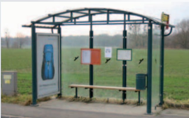
WH/ A/ 3/ 12/ PC (mit Zubehör: s.S. 31-33)