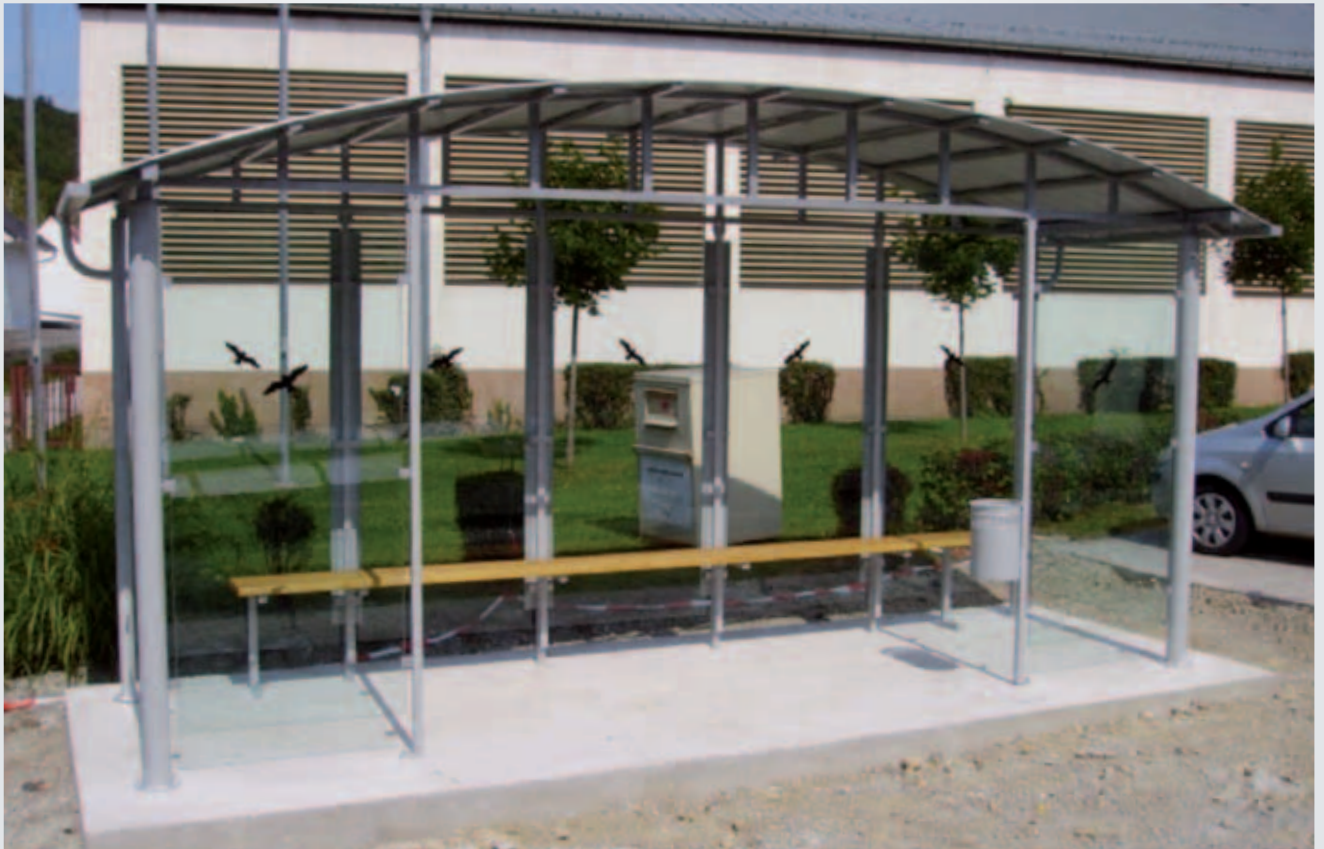
WH/ A/ 5/ 14/ M (mit Zubehör: s. S. 31-33)