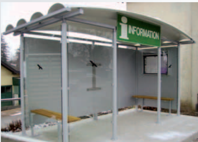
WH/ A/ 4/ 14/ PD (mit Zubehör: s.S. 31-33)