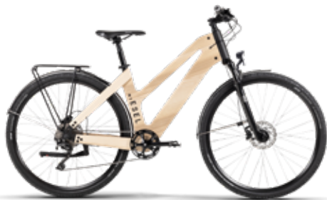
MY ESEL (E-Bike)